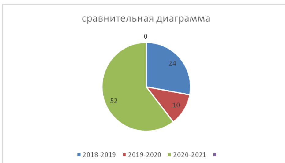
Рисунок 2 - Сравнительная диаграмма 2018-2021 г.

Проанализировав результаты успеваемости за период с 2018 по 2021 год следует, что количество неаттестованных увеличилось, в 2018-2019 учебном году данный показатель увеличился до 24 человек, в 2019-2020 году составило 10 человек, 2020-2021 году составило 52 человека. Сравнительная диаграмма 2018-2021г. представлена на рисунке 2.